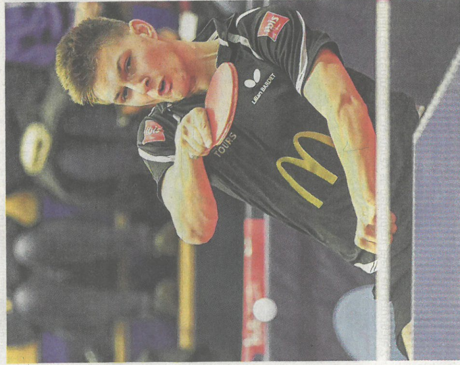
Le jeune pongiste de la 4S Tours représente régulièrement la France lors des compétitions internationales.