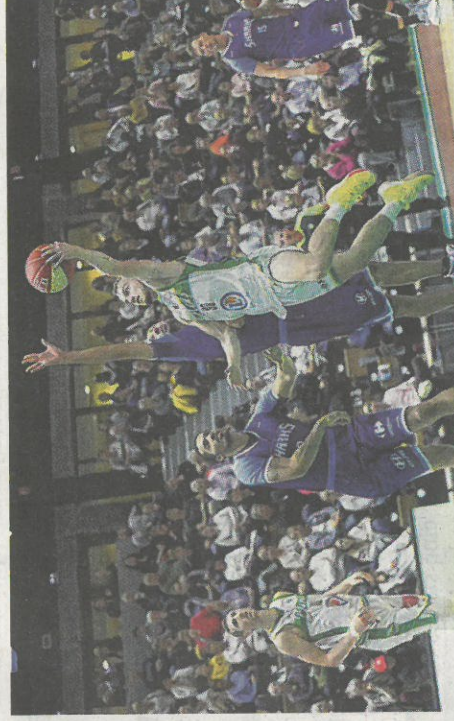
Le meneur tourangeau de 19 ans fait ses gammes à Blois (Pro B), où il a posé ses valises cet été.